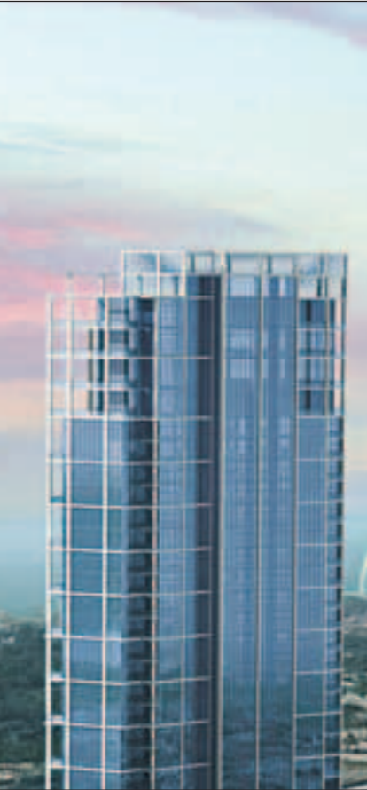
مشروع «أكاسيا أفينيوز» التابع للشركة في موقع مميز بمنطقة الجميرا في دبي مطلا على برج العرب ونخلة الجميرا

في البداية، كيف تنظر إلى الأزمة الاقتصادية في الكويت والتي ألت بظلالها على العديد من الشركات؟ وما تقييمك للحلول المقترحة حتى الآن بشأنها للخروج من النفق المظلم الذي دخله الاقتصاد الوطني بسبب تلك الأزمة وفي مقدمتها قانون الاستقرار المالي المقترح؟